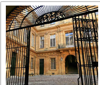
Mairie d'Aix-en-Provence Place de l'Hôtel de Ville 13100 Aix-en-Provence