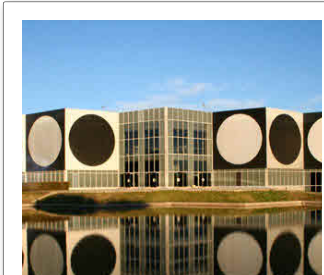
Fondation Vasarely 1, Avenue Marcel Pagnol 13090 Aix-en-Provence