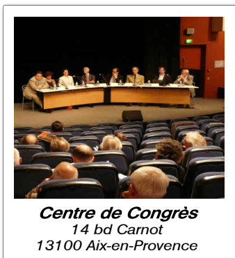
Centre de Congrès 14 bd Carnot 13100 Aix-en-Provence