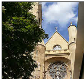
Musée Granet Place St Jean de Malte 13100 Aix-en-Provence