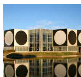
Fondation Vasarely 1, Avenue Marcel Pagnol 13090 Aix-en-Provence

19:30 ► Cena de Gala* *Vestido de etiqueta