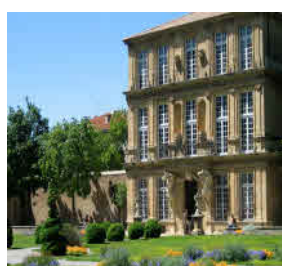
Pavillon Vendôme 13 rue de la Molle 13100 Aix-en-Provence