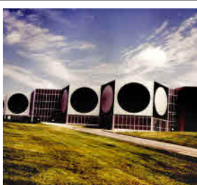
Fondation Vasarely 1, Avenue Marcel Pagnol 13090 Aix-en-Provence