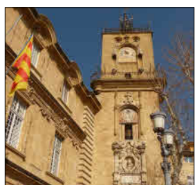
Mairie d'Aix-en-Provence Place de l'Hôtel de Ville 13100 Aix-en-Provence