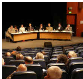
Centre de Congrès 14 bd Carnot 13100 Aix-en-Provence