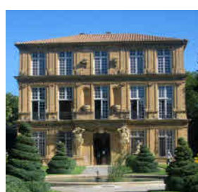
Pavillon Vendôme 13 rue de la Molle 13100 Aix-en-Provence